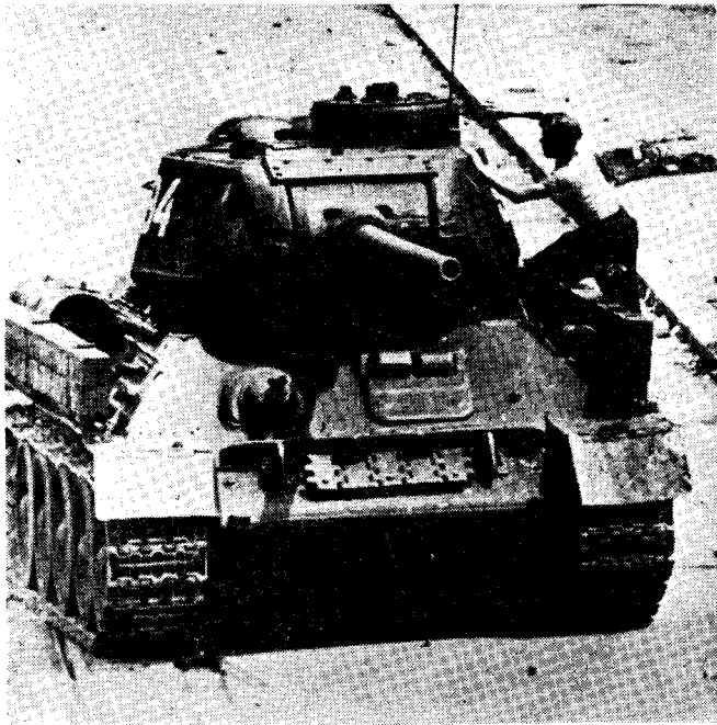
La révolte de Berlin, le 18 juin 1953 demeure le symbole du combat nationaliste en Allemagne.

gendra lui-même un « Freiheit Sozialistisch Partei », groupement bien faible dirigé par Erwin Schoenborn (5 mois de prison pour avoir créé des « groupes d'action » à Berlin, puis 8 mois pour « dif-famation »), et s'occupant surtout de maintenir des relations avec les étudiants arabes !