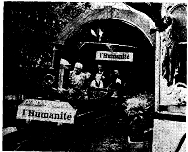
A LA FETE DE L'HUMANITE la « locomotive de l'Histoire... »

Un pays fait exception dans la croissance démographique : l'Allemagne communiste. Non seulement sa population ne s'est pas accrue depuis 15 ans, mais elle a diminué : passant de 18.380.000 en