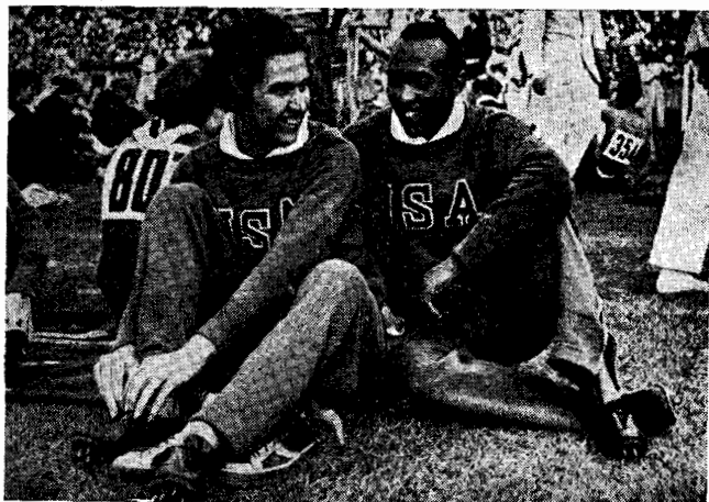
Lors des Jeux Olympiques de Berlin, en 1936, les athlètes noirs avaient, sans difficulté, participé aux compétitions. On voit, ci-dessus, le célèbre champion Jesse Owens, poser pour les photographes allemands. Et pourtant, on était en pleine apogée du National-Socialisme. Mais en 1964, les Afro-Asiatiques sont parvenus à exclure des Jeux Olympiques de Tokyo l'Afrique du Sud. Où sont les racistes ?

Monde » du 18 septembre : « Cet avocat puissant qui fut un guerrier valeureux (il est couvert de décorations, dont l'arche de la couronne belge et la croix de guerre française), s'est transformé en un démagogue sudiste de la pire espèce, ruinant au service d'une cause condamnée la contribution positive qu'il aurait pu